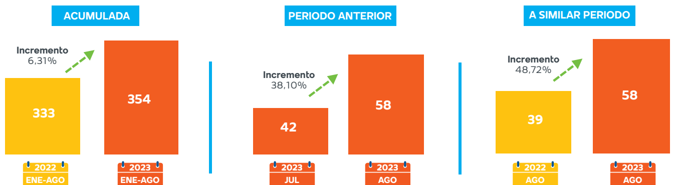
BOLIVIA: VARIACIÓN PORCENTUAL DE LAS DENUNCIAS DE DELITOS CONTRA LA VIDA (1) , 2022 - 2023 (p) (En porcentaje)